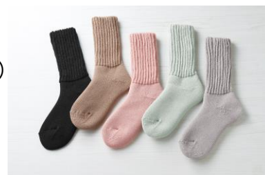
『起毛であったかルームソックス ミドル丈』 ※カラーはお選びいただけません。

来場いただいた方のみ参加できる SNS 投稿キャンペーンを実施します。指定のハッシュタグをつけて会場内の『&ONDO』の展示を Instagram か X(旧 Twitter) に投稿いただくと、『&ONDO (アンドオンド)』の『起毛であったかルームソックス ミドル丈 (AL-C402G)』をプレゼントいたします。(数量限定・なくなり次第終了となります。)